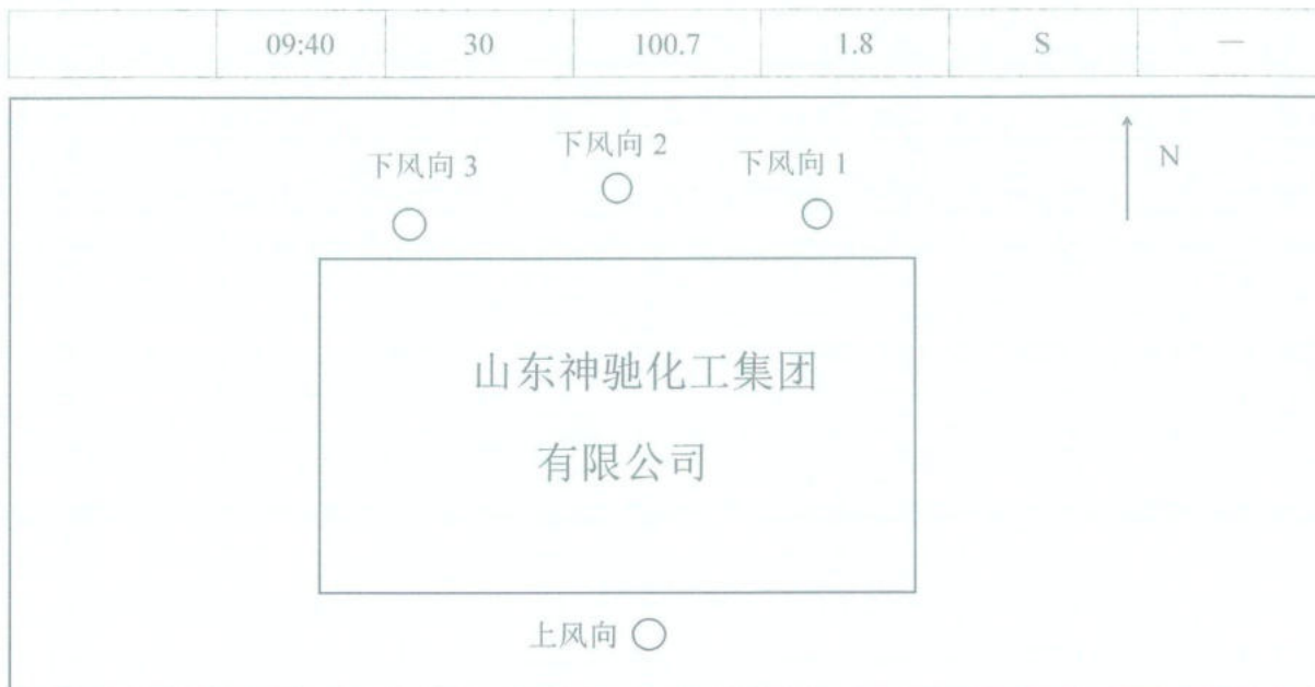
图1 无组织废气采样布点图