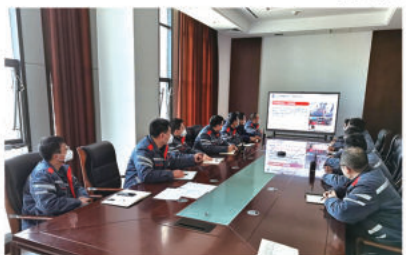
收拾“散漫之心”，按下“奋斗键”，用“心”归位，早返一步。1月28日上午，

仓储公司召开节后收心会，组织上好安全生产第一课，确保全员迅速收心归位，保障公司生产经营平稳有序运行，为圆满完成今年各项任务开好局、起好步。